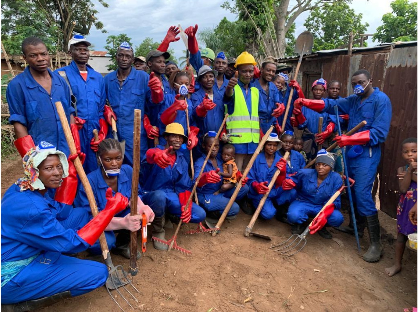
Figure 2: Bukavu : le Fonds social débouche des caniveaux et ramasse des ordures - Le Souverain Libre